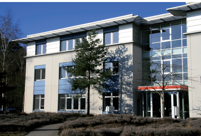
Europarc bei Berlin: Entwicklungszentrale V-Trade und Stammsitz der CountR GmbH